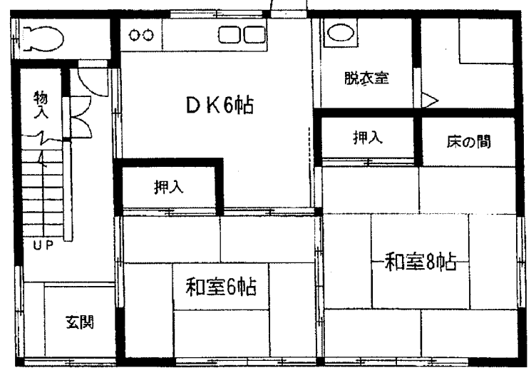
1階平面図: 57.96m 2